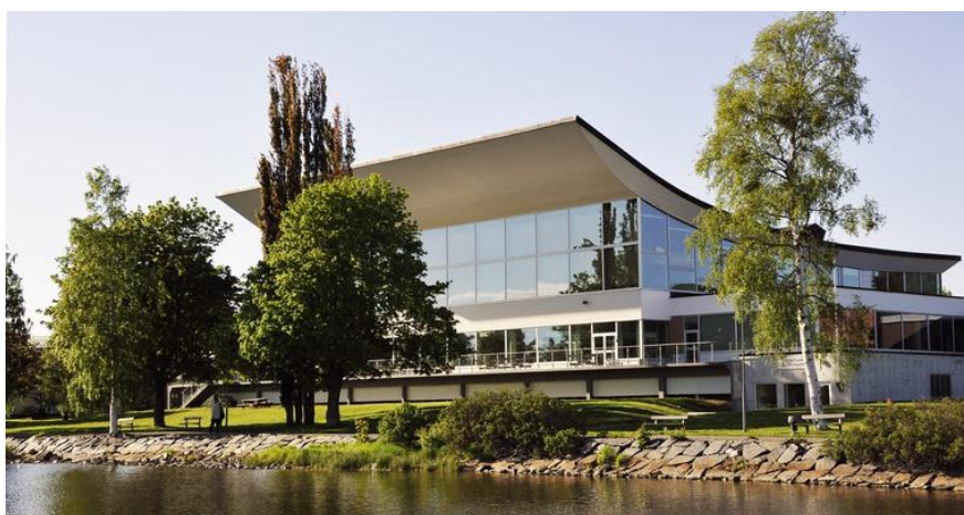
Figur 14. Bild på Härnösands badhus.