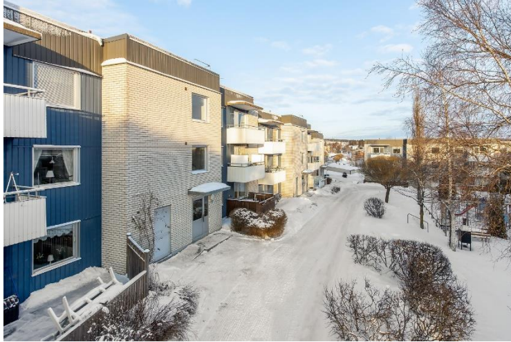
Figur 10. Bild på Kullen.