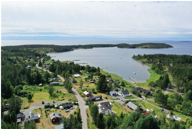
Figur 5. Bild på Solumshamn.

Figur 2 nedan är en karta som visar en mer detaljerad bild över Härnösand tätort och platser som respondenterna nämner i resultatet.