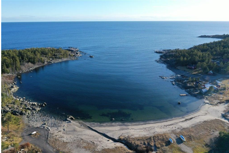
Figur 4. Sjöviken.