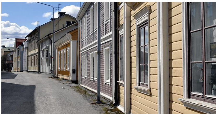
Figur 13. Bild på Östanbäcken.