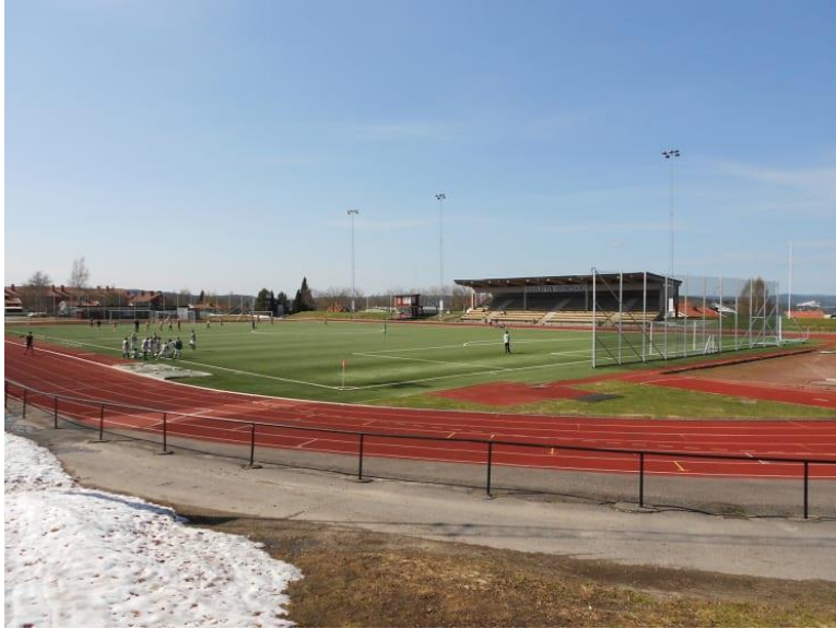
Figur 8. Bild på Högsletten.