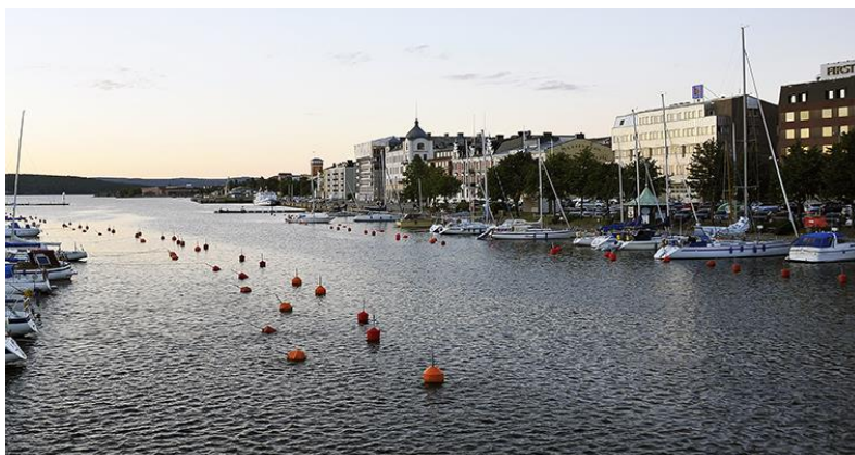
Figur 7. Bild på Skeppsbron.

I figur 2 visas ett område inringat i lila färg vilket är Skeppsbron. Skeppsbron är ett kajstråk som Härnösands kommun just nu arbetar med att förändra. Högsletten öst på kartan är en idrottsanläggning där det bland annat finns en fotbollsplan, inomhushallar, hockeyplaner och ett curlingcenter. Vårdkasen som ligger sydligast på kartan i figur 2 är ett friluftsområde där det finns slalombackar. Kullen som kan ses lite till väst i mitten av kartan är ett bostadsområde med lägenheter. Nickebo, Kattastrand, och Östanbäcken är också tre bostadsområden i Härnösand som ligger belägna längst havet. Nedan kommer bilder på dessa platser att visas.