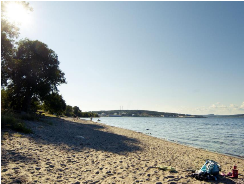
Figur 2. Bild på Sälsten.