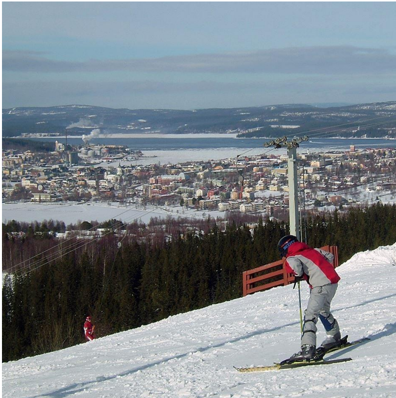
Figur 9. Bild på Vårdkasen.