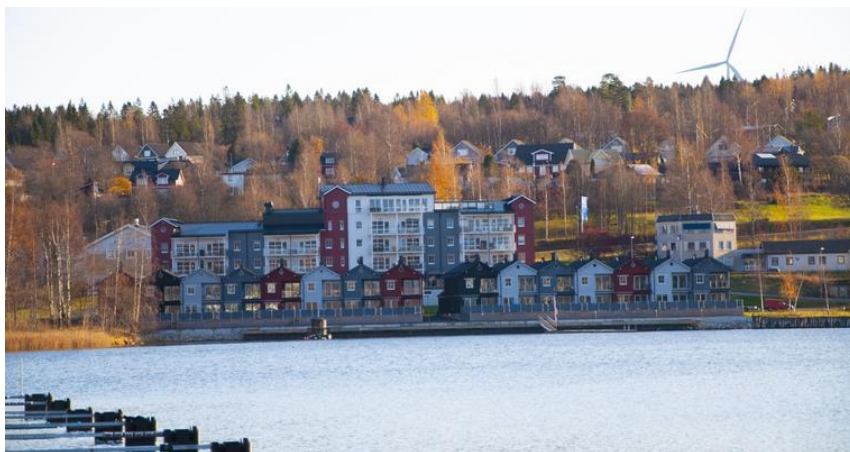
Figur 12. Bild på Kattastrand.