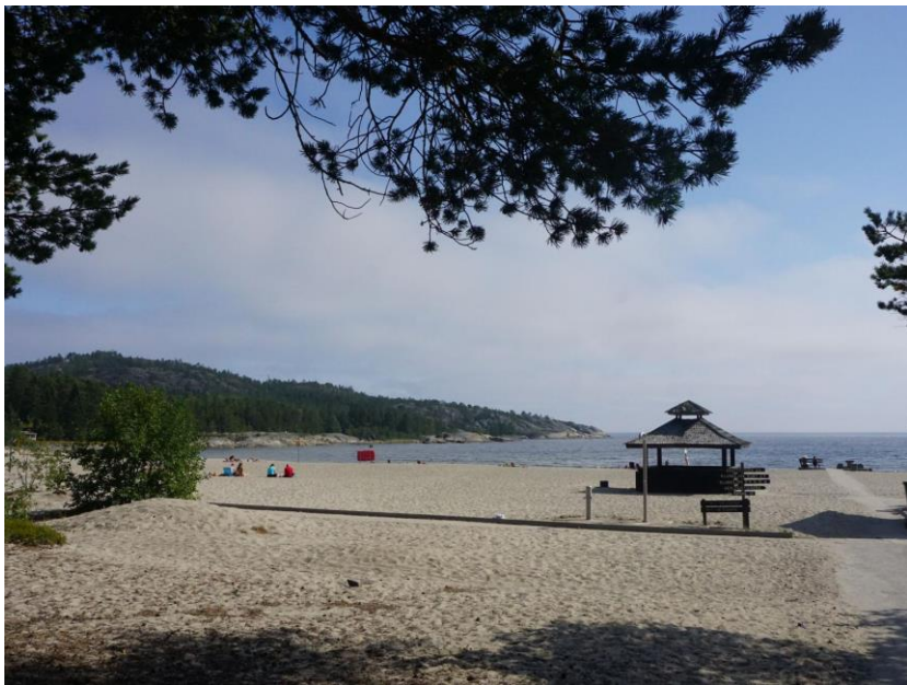
Figur 3. Bild på Smitingen.