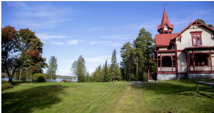
Figur 11. Bild på Nickebo.