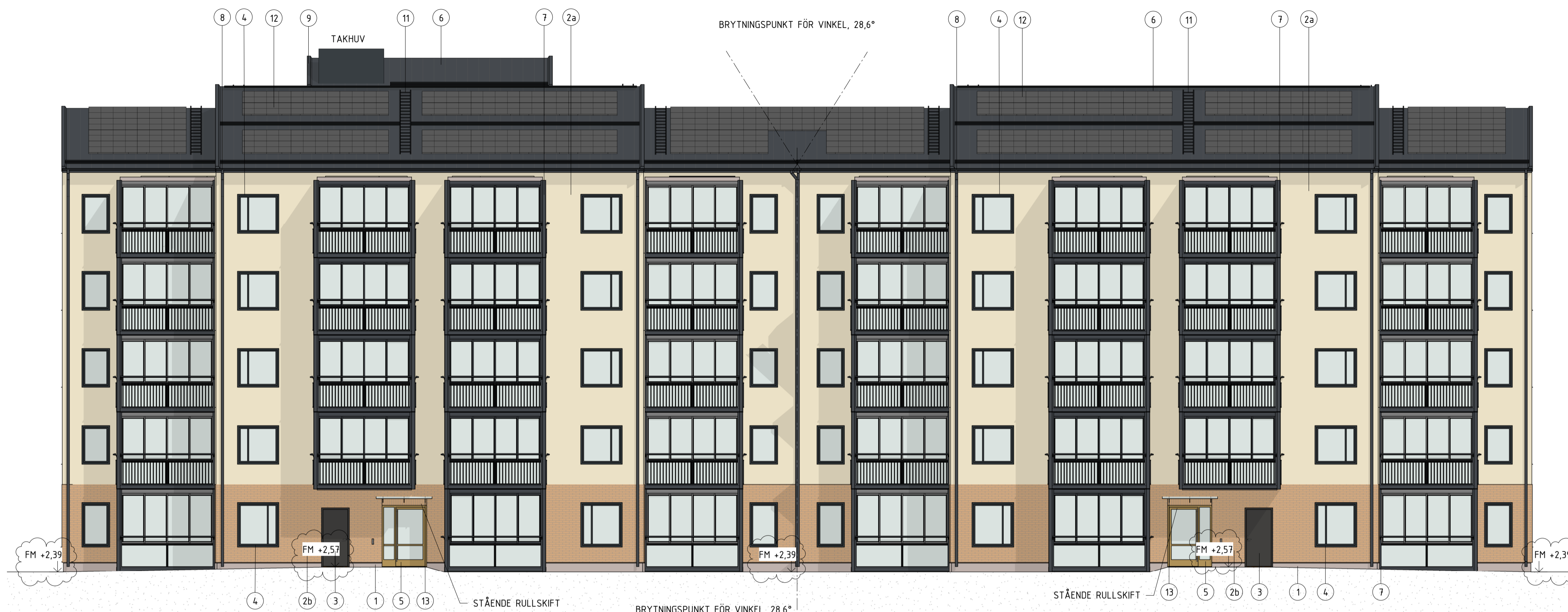
FASAD MOT SYD (HUS B)