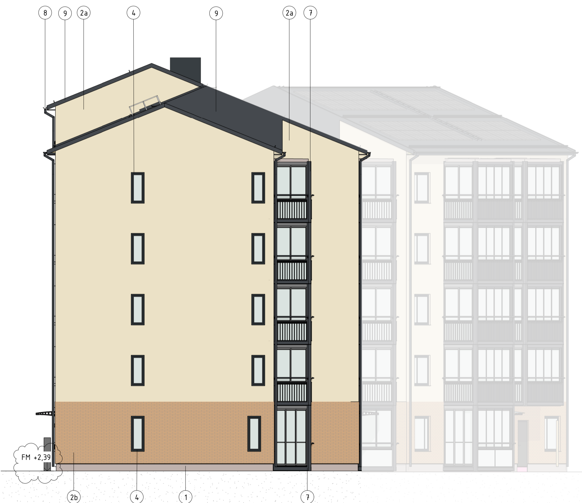
FASAD MOT VÄST (HUS B)