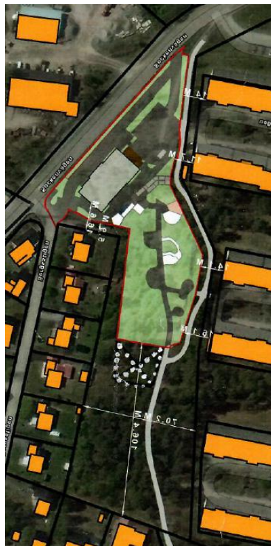
Figur 1. Bifogat material från Brf. Fyren

mindre och måttlig förlängning behöver väl inte hindra. Medskickad kartbild visar med en X-markering vad vi menar.