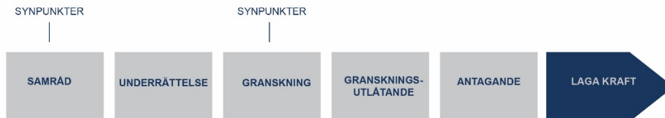
Figur 2. Illustration över standardförfarandets olika skeden

Tidplanen är preliminär och är beroende av när säsongsspecifika underlag och utredningar kan tas fram för planområdet.