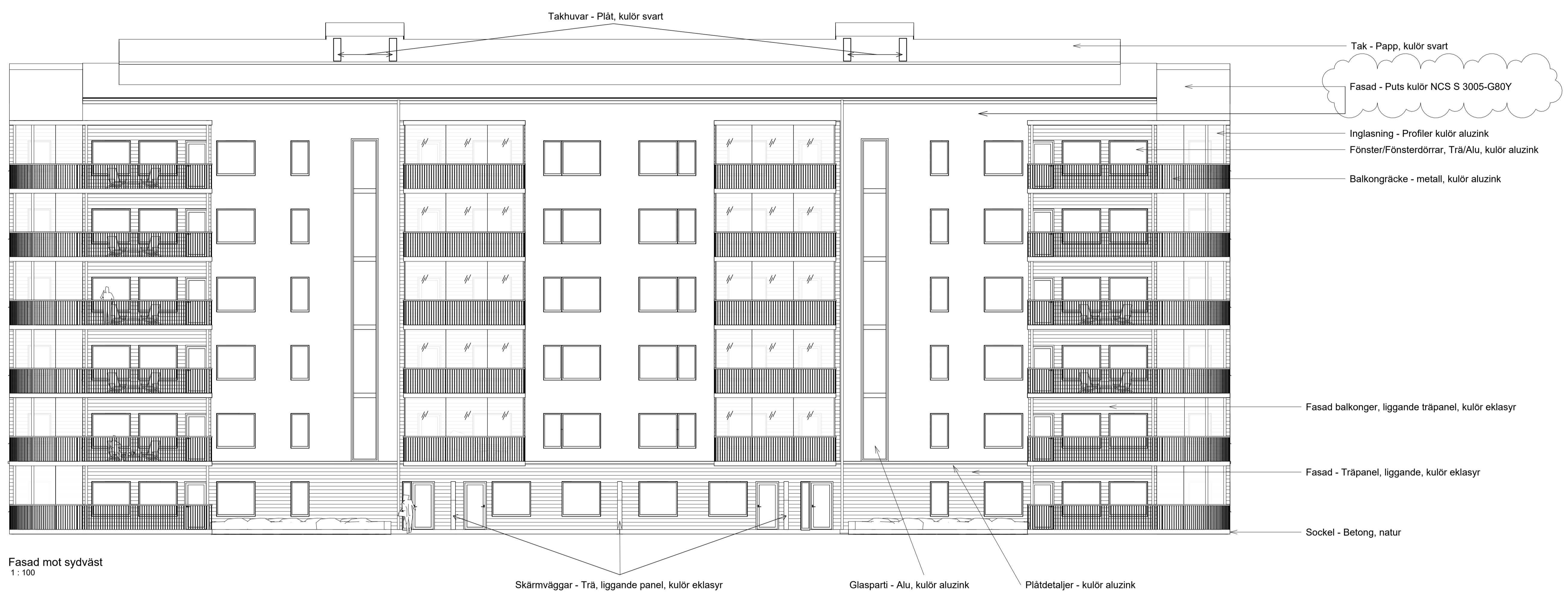
Fasad mot sydväst 1 : 100

FÖRESKRIFTER Taksäkerhet enligt "branschstandard taksäkerhet" och senast gällande BBR