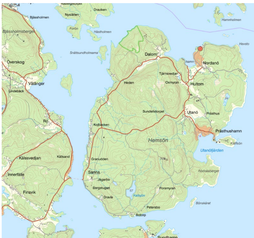
Figur 1. Planområdets placering på Hemsön

Ett förslag till detaljplan har upprättats för att utveckla Nordanövikens på Hemsön med 18 tomter, se figur 1 nedan.