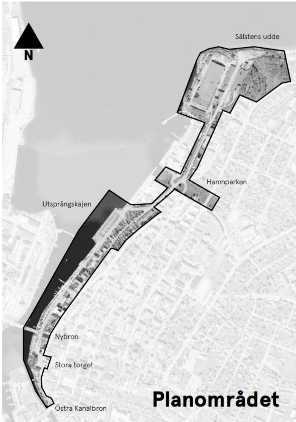
Figur 1. Planområdet för Planprogram Skeppsbron