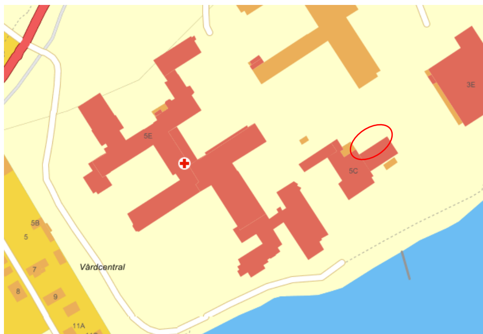
Figur 3. Översiktskarta, cisterners placering inringat rött

Vid fältundersökningarna framkom det uppgifter om att både olja, diesel och bensin påträffats vid olika schaktarbeten inom området. På 70-talet fanns det fartyg som la till vid stranden, dessa fartyg fraktade olja. Det har funnits två cisterner ovan mark bakom nuvarande panncentral, se figur 3, och att en oljeledning gick till vattnet, som vilken fartygen användes för att tanka cisternerna från fartygen. Det har tidigare funnits en träledning från panncentralen som påträffats vid tidigare schaktarbeten, i vilken där det enligt muntliga uppgifter påträffats förekommit olja i.