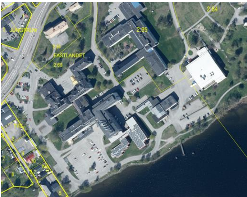
Figur 1. Översiktskarta på fastigheten Fastlandet 2:60. (Lantmäteriet)