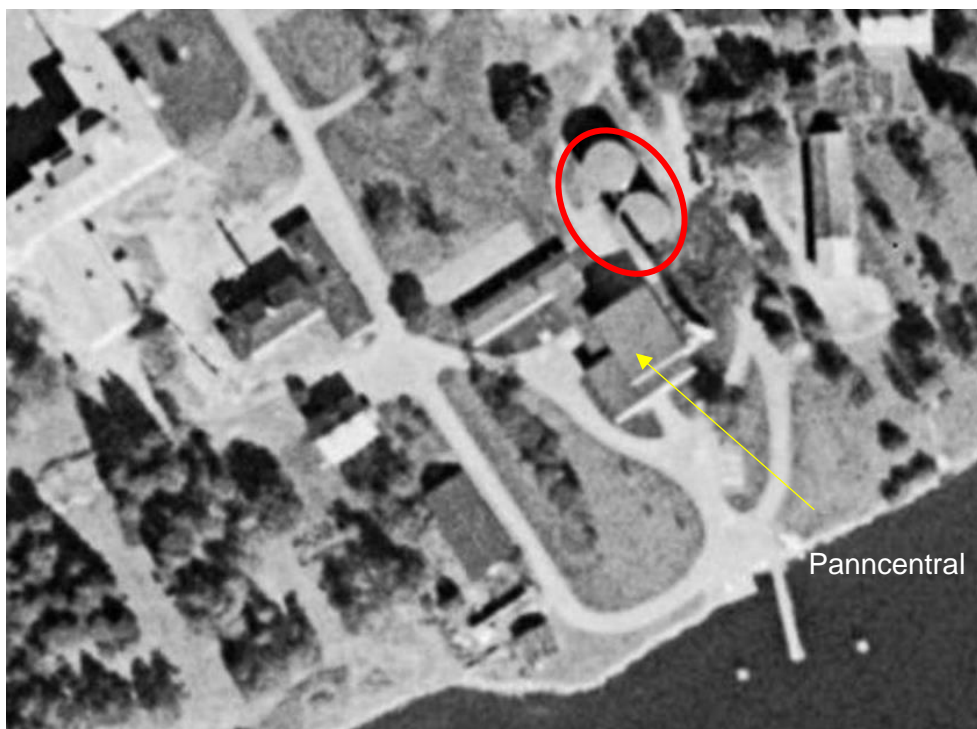
Figur 2. Historiskt flygfoto från 1955-1967 med de två cisternerna synliga inom röd markering.

På fastigheten finns det tre oljeavskiljare, två kopplad till parkeringsytor samt en i en tvätthall.