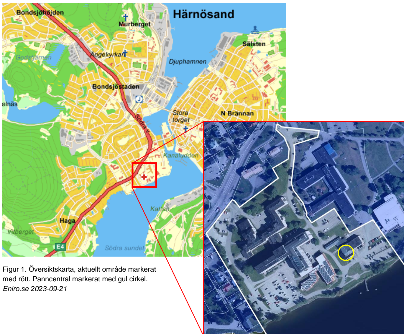
Figur 1. Översiktskarta, aktuellt område markerat med rött. Panncentral markerat med gul cirkel. Eniro.se 2023-09-21