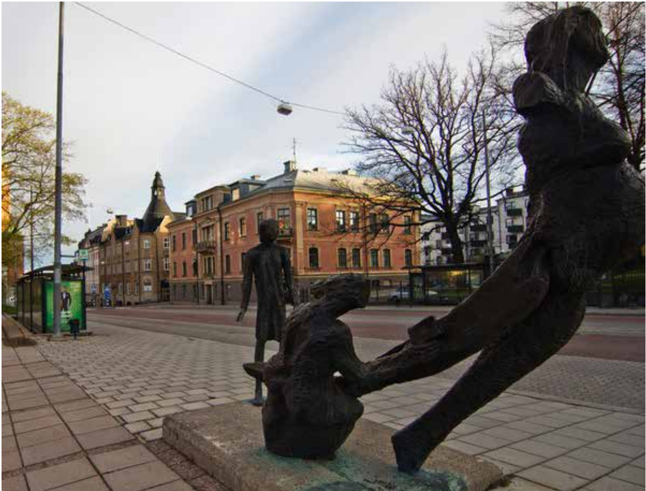
”Form För kunskap” av Olof Hellström

Nybrogatan är Härnösands viktigaste pulsåder och en av endast två förbindelser mellan Härnön och fastlandet. Gatan har därmed en avgörande betydelse för stadens infrastruktur, trafik och utveckling. I genomsnitt passerar cirka 16 000 fordon dagligen över Nybron, som även utgör stadens viktigaste stråk för busstrafik.