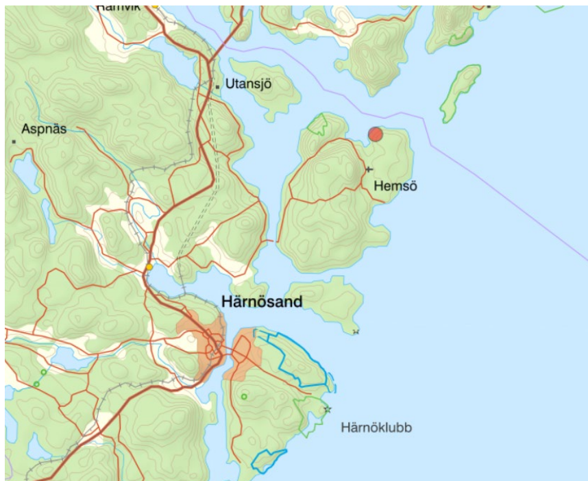
Figur 1. Aktuellt område för detaljplan markerad med en röd cirkel, del av fastigheten Nordanö 5:1.

Planområdet ligger på norra delen av Hemsön, en ö cirka 1 mil öster om tätorten Älandsbro på del av fastigheten Nordanö 5:1.