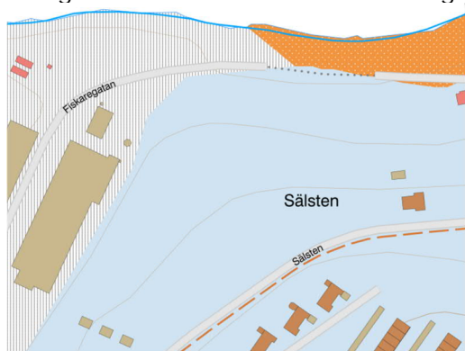
Figur 3. Jordartskarta (sgu.se)

Marken vid fastigheterna består till stor del av morän likt jordartskartan med ett ytskikt av humushaltig fyllning av grus och sand. Enligt tidigare undersökningar finns ett lerlager i nordvästra delen, vilket även utförda undersökningar visar. Detta påverkar fastigheten C6. Siltmoränen och lerlagret har materialtyp 5A och tjälfarlighetsklass 4.