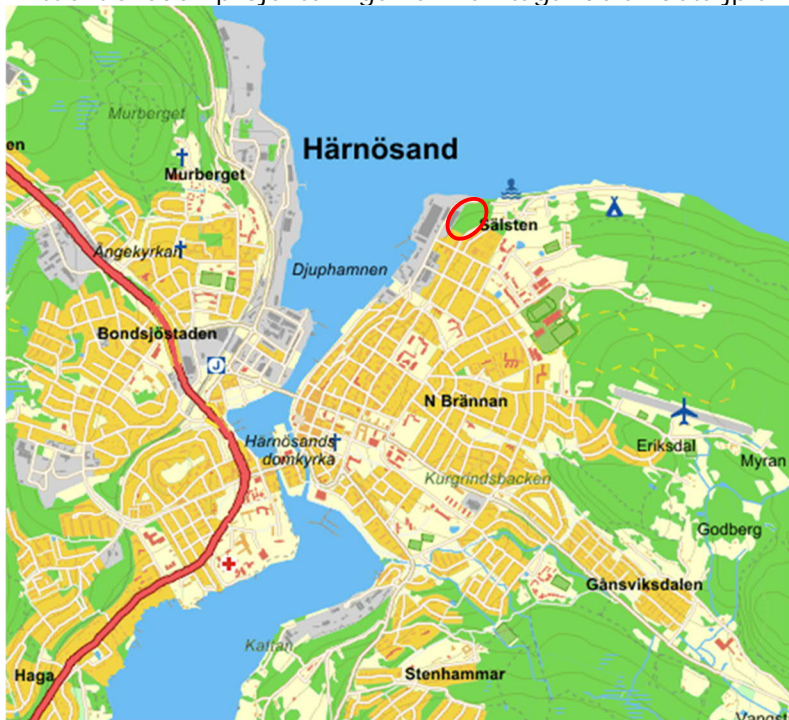
Figur 1. Översiktskarta, lokalisering av undersökt område (eniro.se)

Aktuellt skede i projekteringen är framtagande av detaljplan för området.